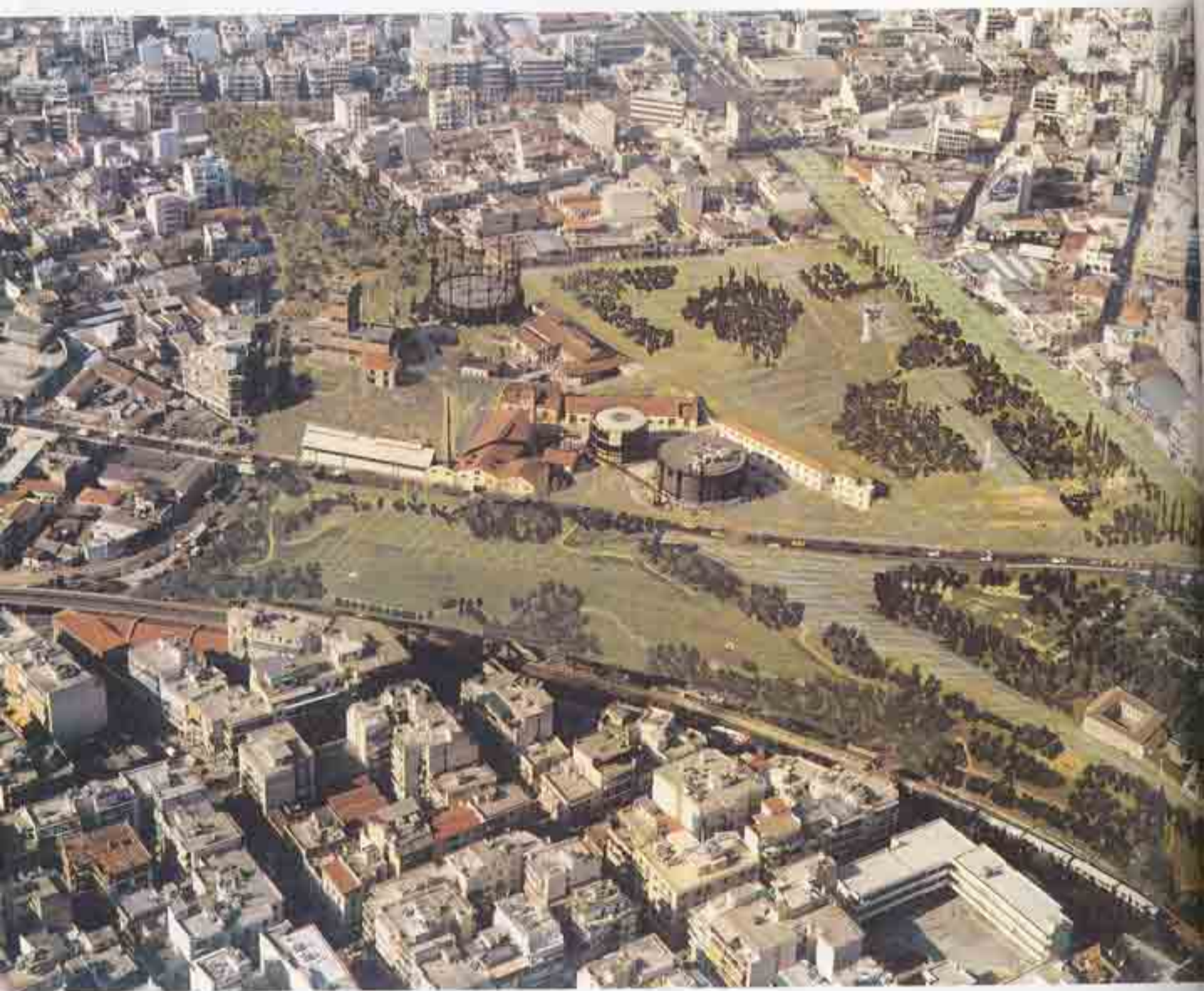
Η περιοχή του Κεραμεικού όπως προκειται να διαμορφωθεί.